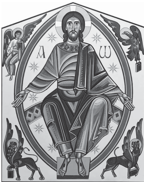
Cristo veniente, Chiesa di San Masseo - Assisi

Ascolta il nostro grido e il gemito che sale dalla terra perché nell'ora in cui si fa già notte si levi il giorno della tua venuta.